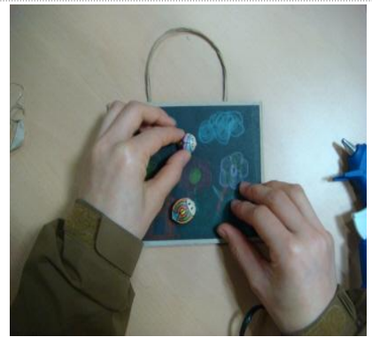
원하는 위치에 붙이기