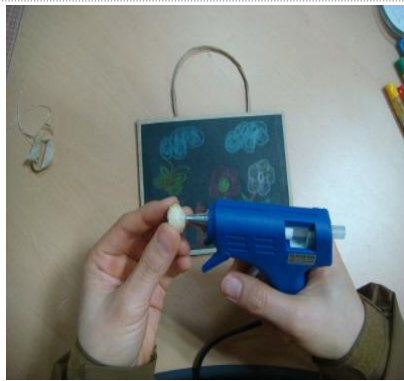
글루건을 이용해 은행열매 고정