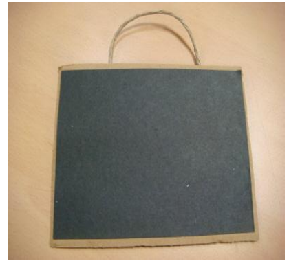
페박스에 검정도화지 붙이기