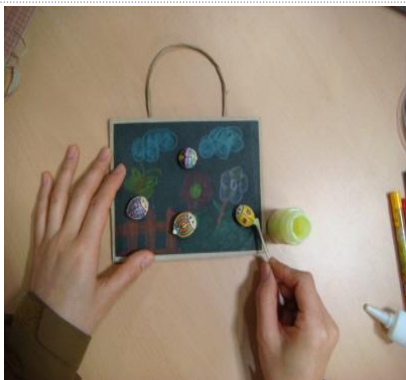
반딧불이 엉덩이 부분에 야광물감 칠하기