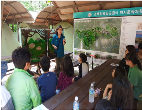
운영사진_1 남천야영장 해설