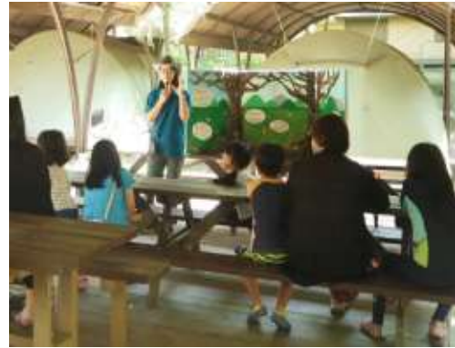
운영사진_2 남천야영장 해설