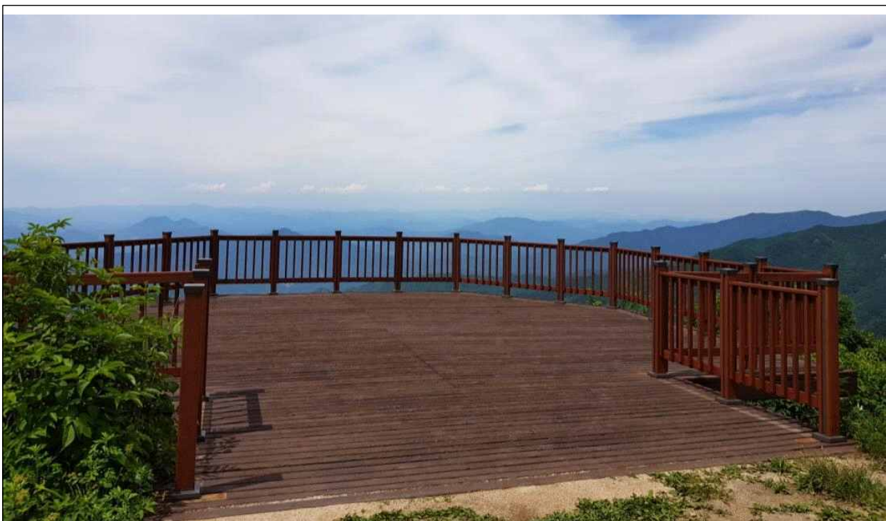
제2연화봉 전망대 근경