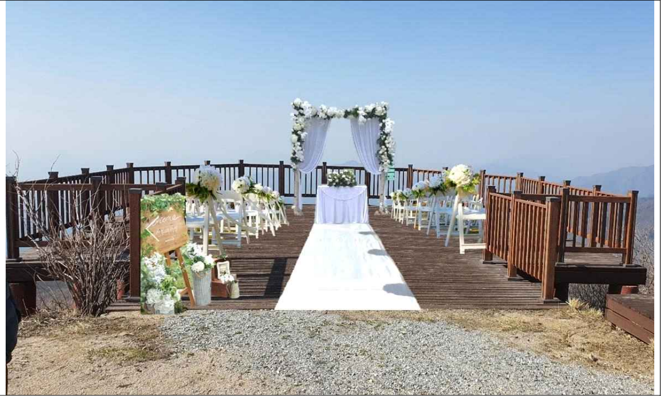
소백산 산상 결혼식 예상 이미지