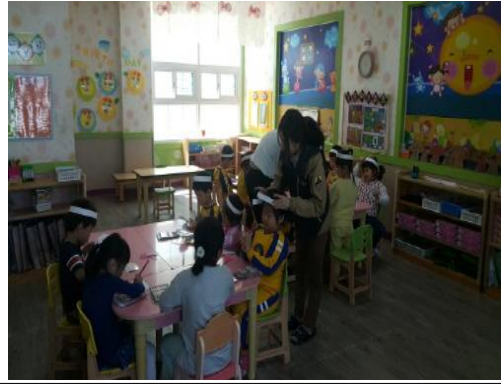
(운영사진_머리띠 길이에 맞게 자르는 모습)