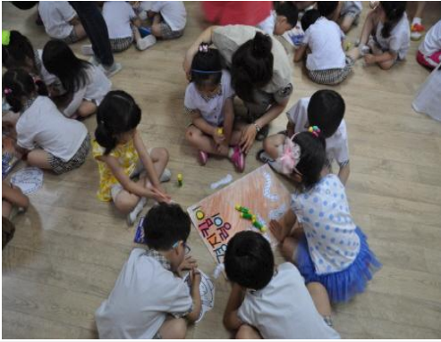
(운영사진_지렁이 그림도안을 배경판에 붙이는 모습)