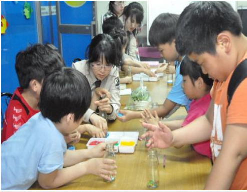
(운영사진_공병에 색돌 넣는 모습)