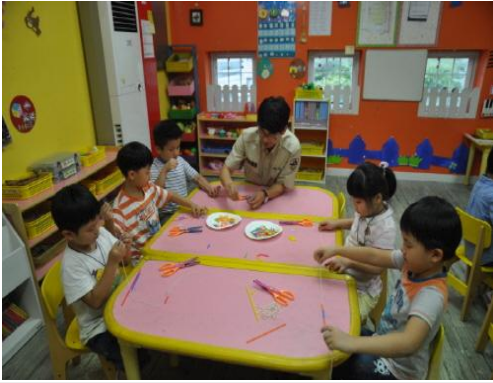
(운영사진_실에 빨대끼우는 모습)