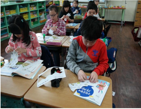
(운영사진_개구리한살이퍼즐 도안에서 떼기)