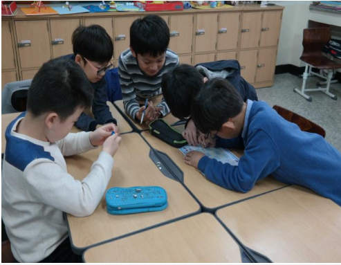
(운영사진_빙고판에 바다식물 이름 적는 모습)