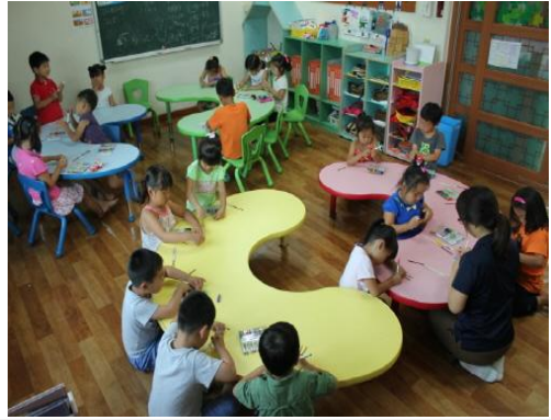
(운영사진_아이스크림막대 꾸미는 모습)