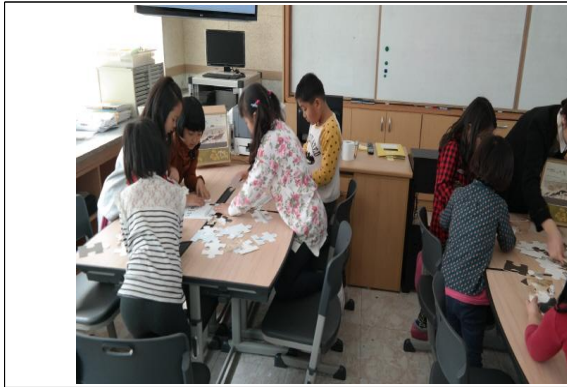
(운영사진_퍼즐 맞춰보는 모습)