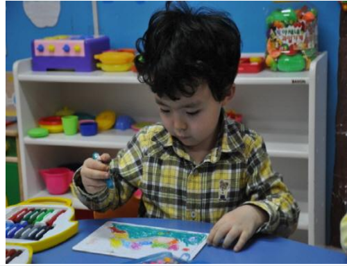
(운영사진_지도퍼즐한 색칠하는 모습)