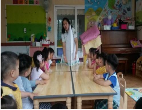
(운영사진_생태계피라미드 설명하는 모습)