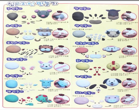
(운영사진_만들기안내문에 따라 만들기)