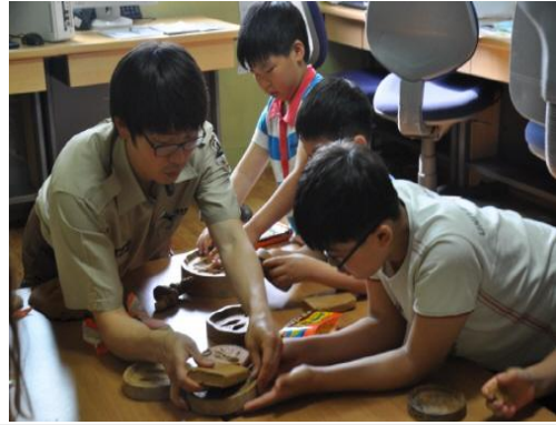
(운영사진_점토를 발자국틀에 넣는 모습)