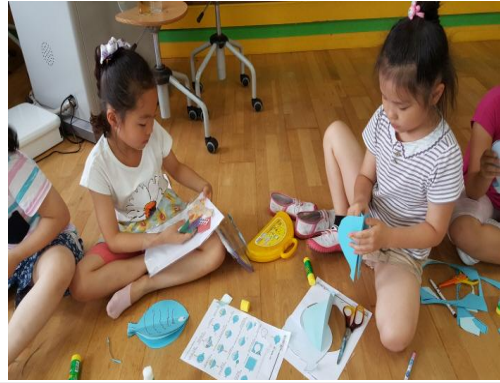
(운영사진_물고기 색지 꾸미는 모습)