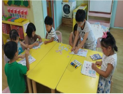
(운영사진_퍼즐판 맞춰보는 모습)