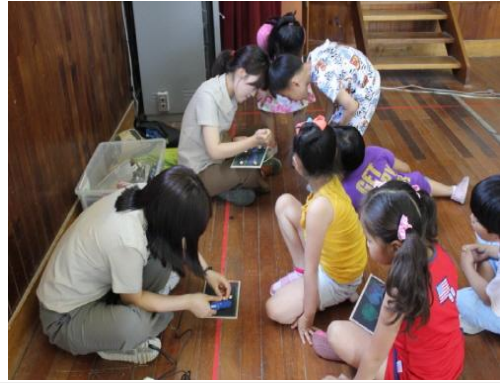
(운영사진_흑도화지에 은행열매 붙이는 모습)