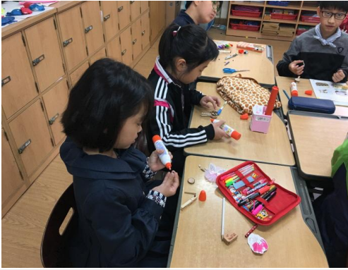
(운영사진_나무조각 목공풀로 붙이는 모습)