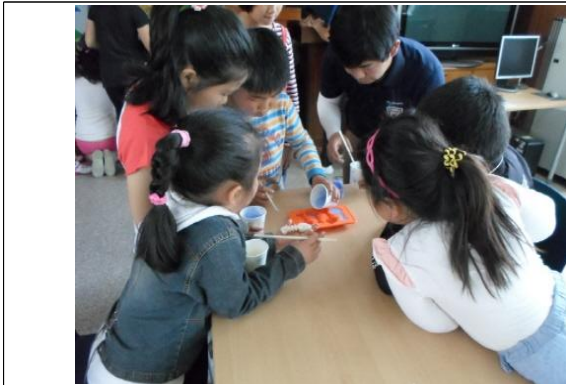
(운영사진_몰드에 비누베이스 붓는 모습)