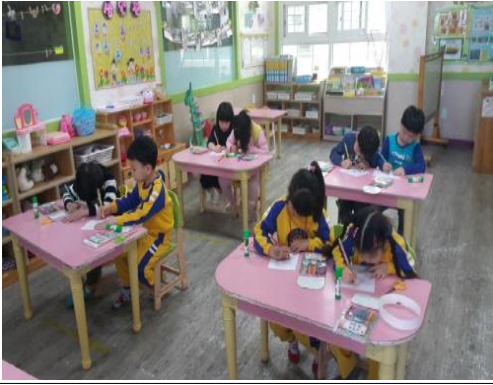
(운영사진_그림도안 색칠하는 모습)