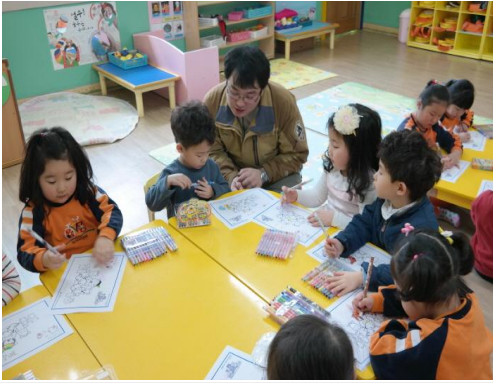
(운영사진_그림도안 나누어주는 모습)