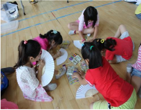
(운영사진_부채에 그림그리는 모습)