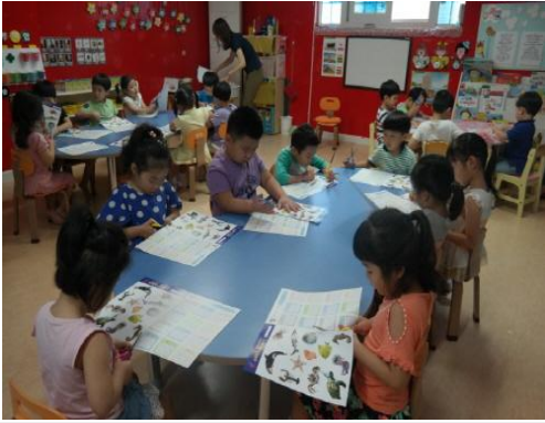
(운영사진_그림도안 자르는 모습)