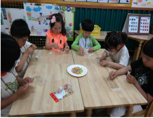
(운영사진_비닐봉투에 스티커 붙이는 모습)