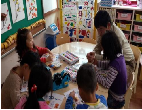
(운영사진_PS판에 그림그리는 모습)