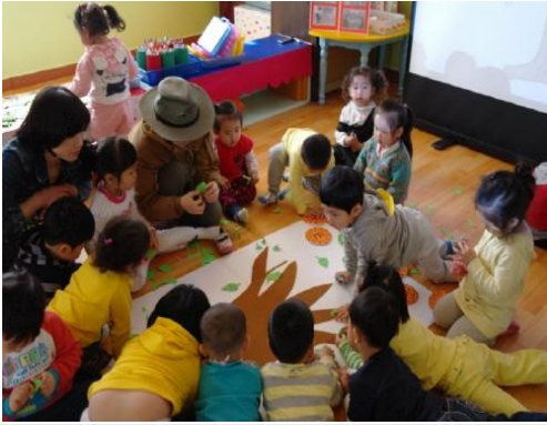
(운영사진_나뭇잎 만드는 모습)