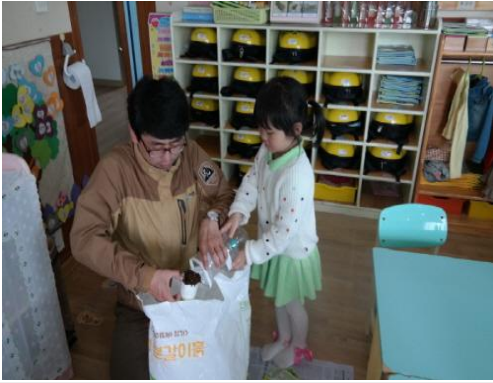
(운영사진_배양토 나눠주는 모습)