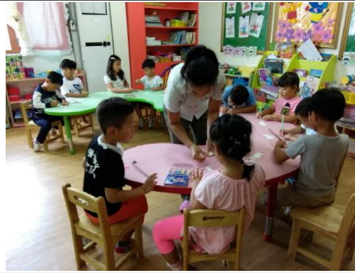
(운영사진_거북이 그림도안 색칠하는 모습)