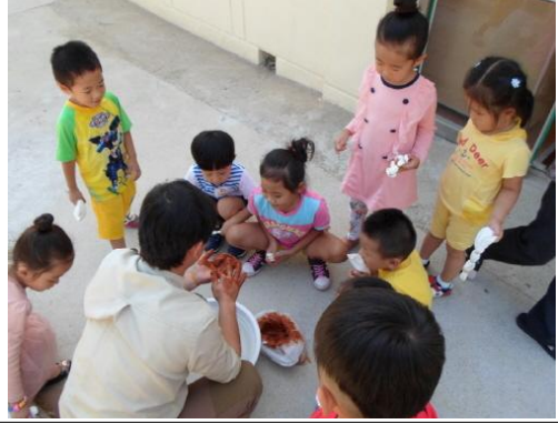
(운영사진_황토염색물에 담근 준비하는 모습)