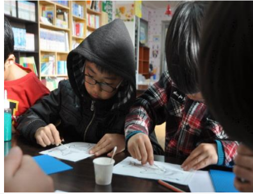
(운영사진_그림도안에 본드 칠하는 모습)