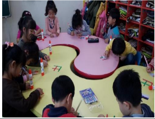
(운영사진_붙인 종이에 그림 그리는 모습)