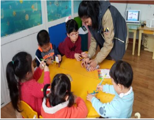
(운영사진_나무막대로 물고기만드는 모습)