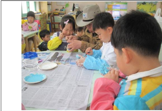
(운영사진_솔방울 색칠하는 모습)