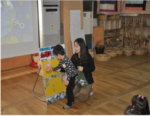
(운영사진_뽑은 쓰레기 쓰레기분리수거판에 붙이는 모습)