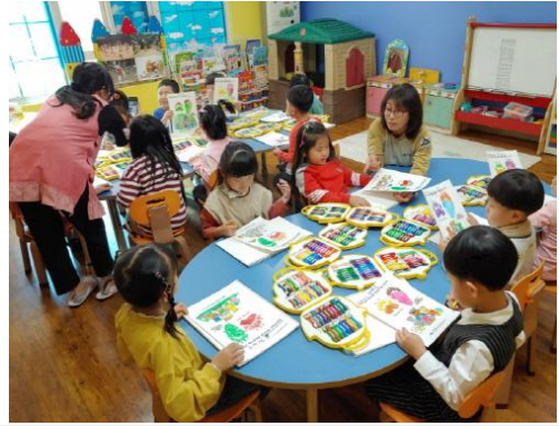
(운영사진_반달가슴곰과 친구들 꾸미기)