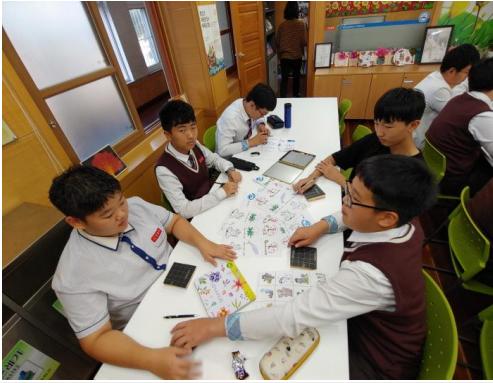
(운영사진_꺾어놓은 구슬을 양쪽으로 묶기)