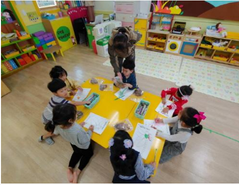
(운영사진_잠자리 그림도안에 색칠하는 모습)