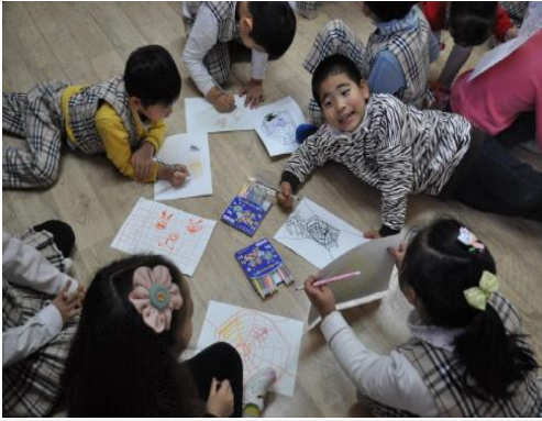
(운영사진_도화지에 거미줄 그리는 모습)