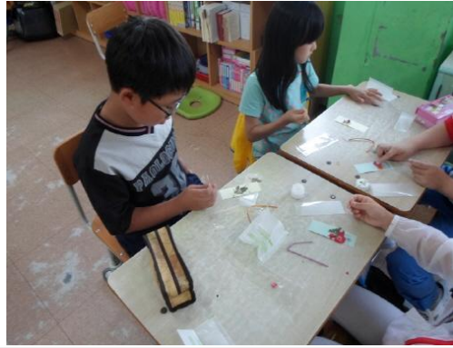
(운영사진_코팅지 붙이는 모습)