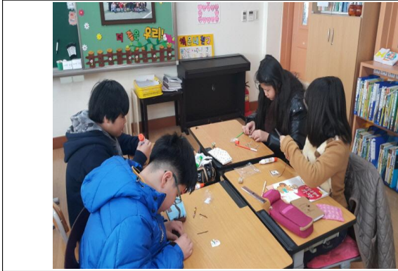
(운영사진_막대기에 나무조각 붙이는 모습)