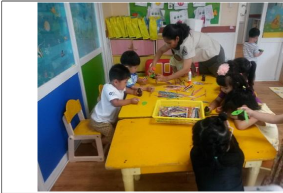
(운영사진_요구르트병에 날개붙이는 모습)