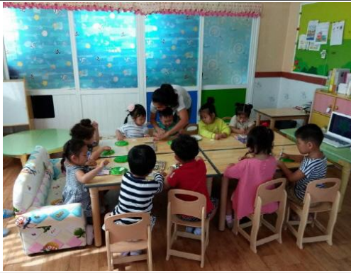
(운영사진_만드는 방법 설명하는 모습 )