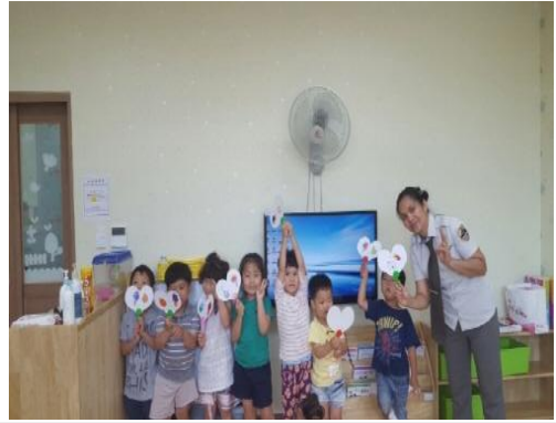
(운영사진_완성한 부채들고 단체사진)