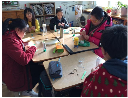
(운영사진_나무막대기 꾸미는 모습)