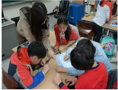
(운영사진_빙고게임판 채워가는 모습)