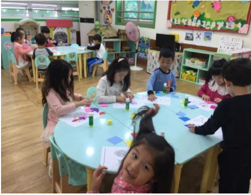
(운영사진_그림도안에 붙일 색종이 구상)