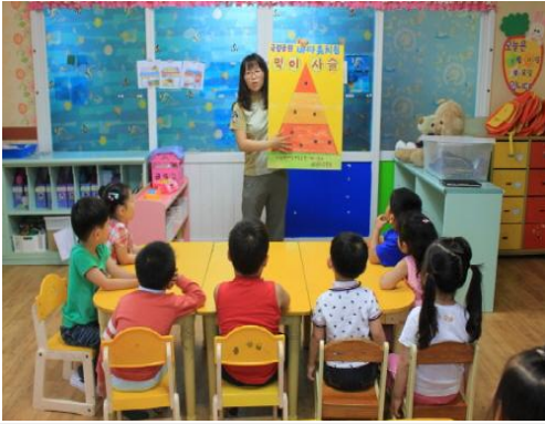
(운영사진_먹이사슬판 설명하는 모습)