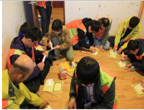
(운영사진_사진일지 작성하는 모습)