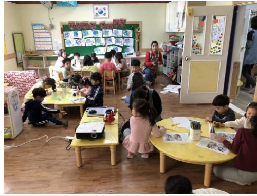
(운영사진_솔방울장난감 만드는 모습)