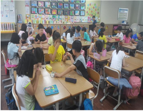
(운영사진_동물모양반지 꾸미는 모습)