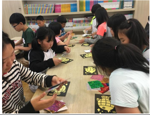
(운영사진_색지로 꾸며보는 모습)