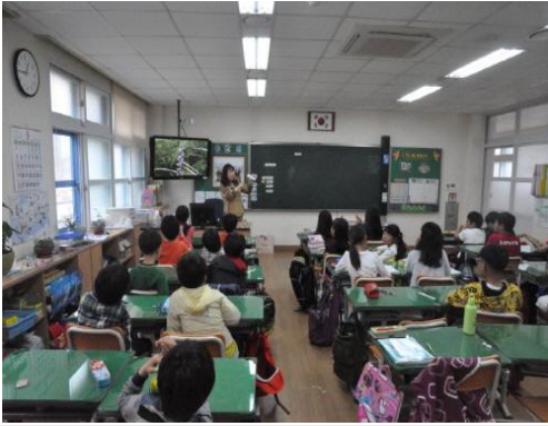
(운영사진_누름꽃자 만드는 방법 설명)