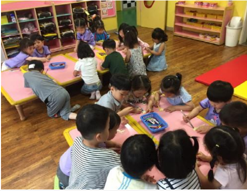
(운영사진_곤충모양스티크 색칠하는 모습)