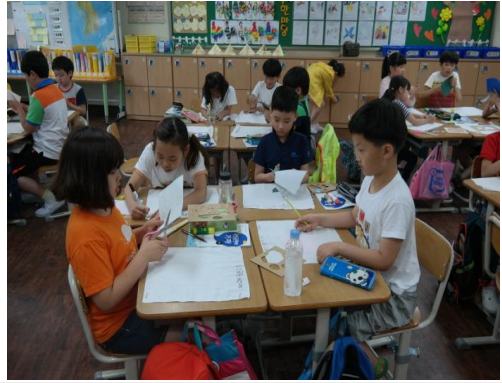
(운영사진_오린 염색종이로 손수건 꾸미기)