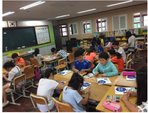
(운영사진_동물모양반지 꾸미는 모습)