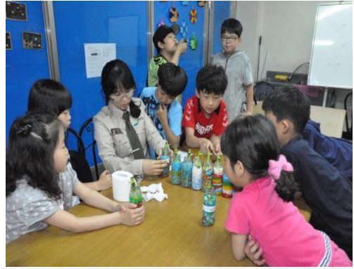
(운영사진_개운죽 꽃아 완성하는 모습)