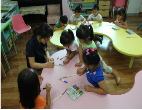
(운영사진_아이스크림막대 꾸미는 모습)