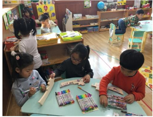
(운영사진_나무판에 색칠하는 모습)