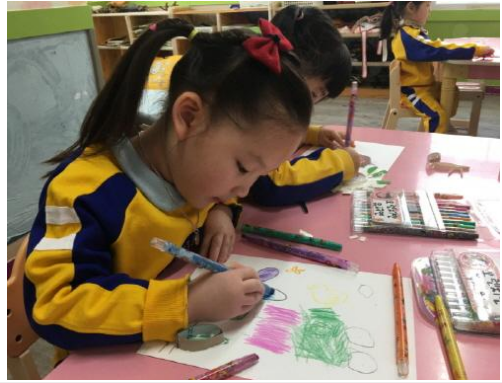
(운영사진_도화지에 그림그리는 모습)