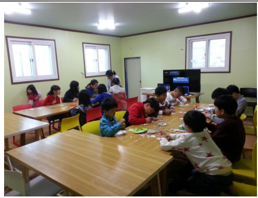
(운영사진_봄꽃 왕관 만드는 모습)