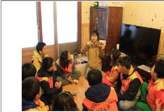
(운영사진_사진일기 만드는 방법 설명)