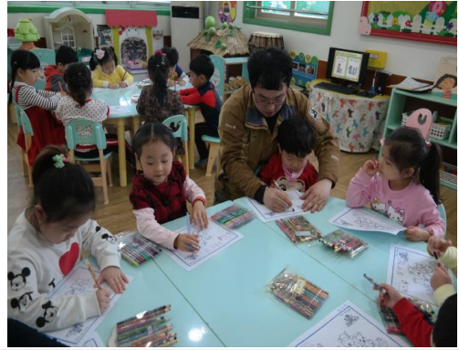
(운영사진_그림도안 색칠하는 모습)