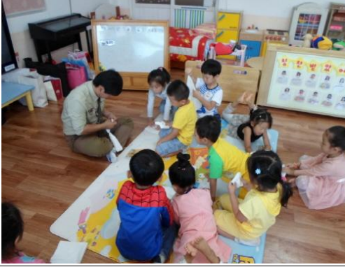
(운영사진_손수건 실로 묶는 모습)