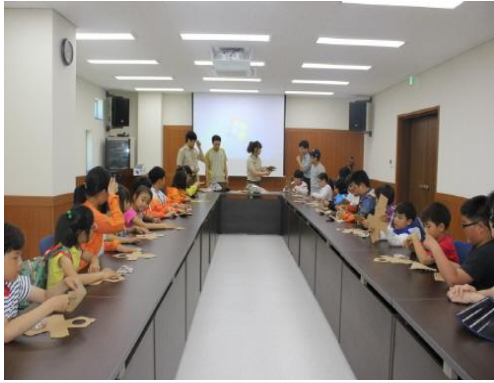
(운영사진_종이접어 새집만드는 모습)