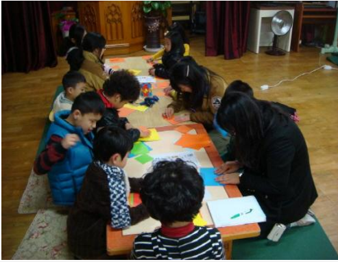
(운영사진_색지접어 연필꽃이 만드는 모습)