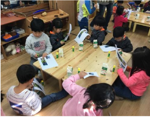
(운영사진_그림도안 및 사진을 자르는 모습)