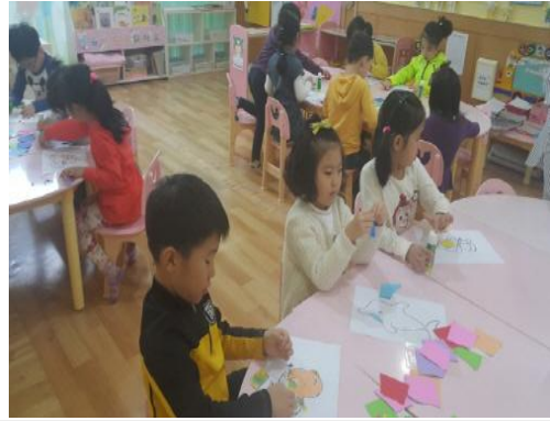
(운영사진_색종이를 찢어서 붙이는 모습)