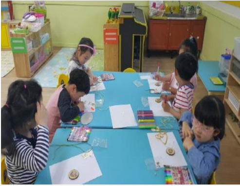
(운영사진_나무작품 색칠하는 모습)