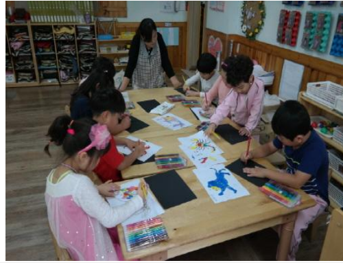
(운영사진_흑도화지에 별자리 그리는 모습)