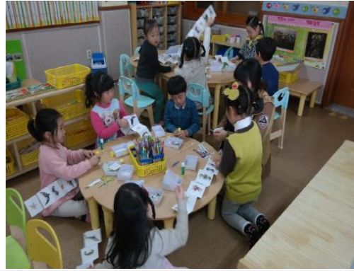
(운영사진_속지에 그림도안 붙이는 모습)