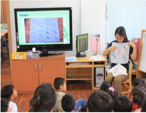
(운영사진_손수건 꾸미는 방법 설명)