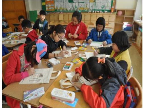
(운영사진_에코백에 그림그리는 모습)