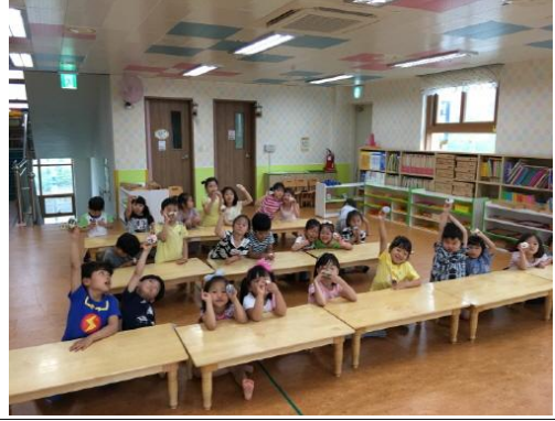
(운영사진_완성한 천뱃지와 단체사진)