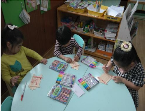
(운영사진_나무액자 만드는 모습)