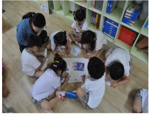
(운영사진_지렁이그림도안 색칠하는 모습)