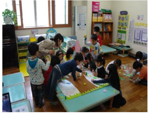
(운영사진_나무에 나뭇잎 붙이는 모습)