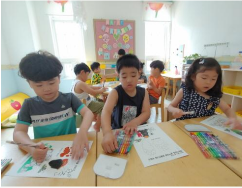
(운영사진_반달가슴곰과 친구들 꾸미기)