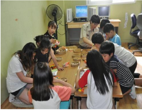
(운영사진_점토 반죽하는 모습)