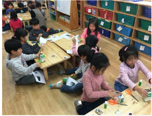
(운영사진_자른 사진을 우유팩에 붙이는 모습)