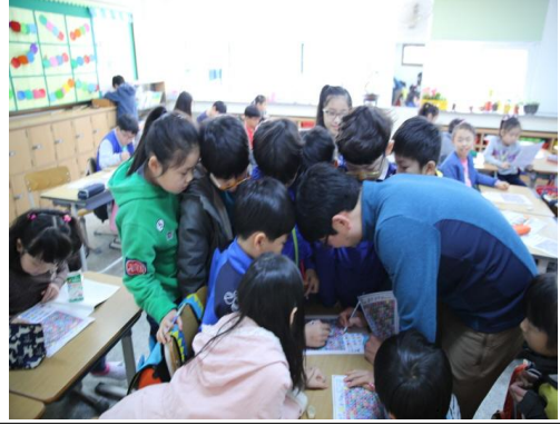
(운영사진_찾은 단어 확인하는 모습)