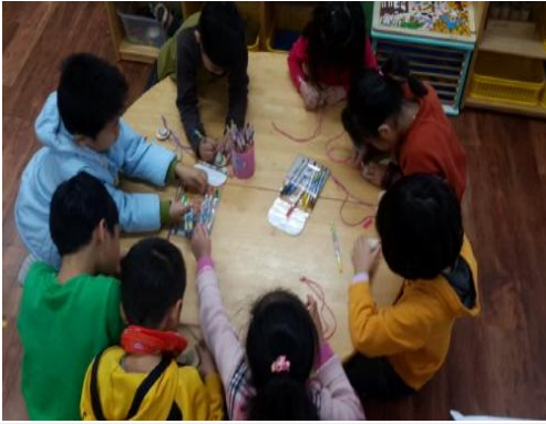
(운영사진_나무원판에 그림그리는 모습)