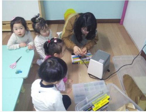
(운영사진_PS판 오븐에 굽는 모습)