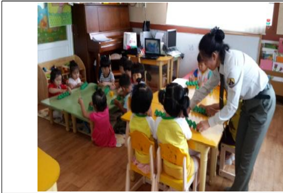
(운영사진_계란판으로 애벌레 만드는 모습)