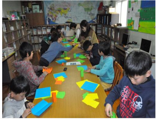
(운영사진_색지접어 연필꽃이 만드는 모습)