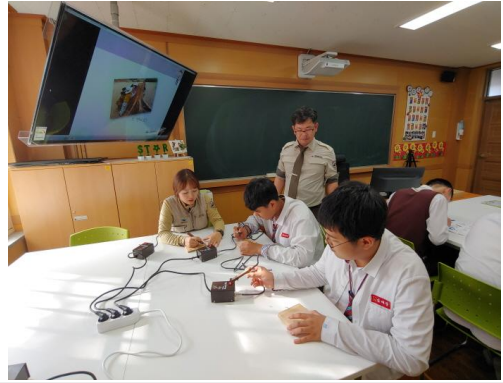
(운영사진_꾸민 나무판 브로치핀에 붙이기)