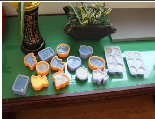
(운영사진_몰드에서 굳어가는 비누)