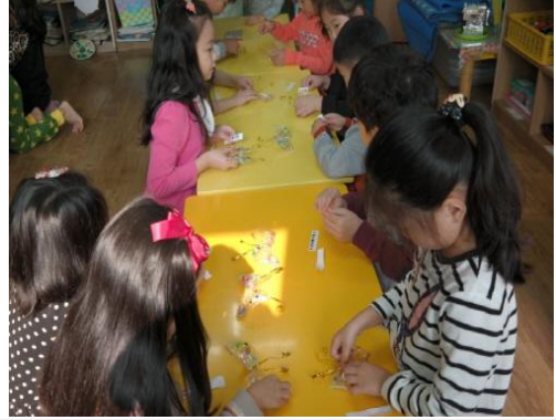
(운영사진_비닐 가운데 빵끈 묶는 모습)