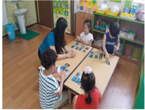
(운영사진_그림카드 순서정하는 모습)