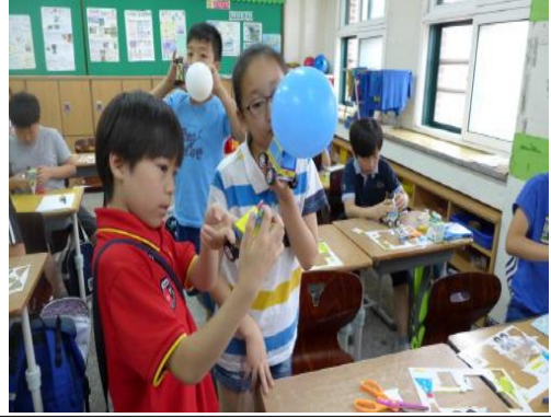
(운영사진_풍선을 불어 자동차 움직임 관찰)