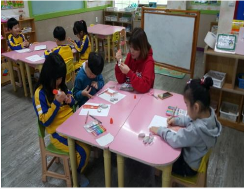
(운영사진_자른 휴지심 붙이는 모습)