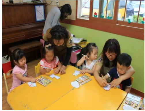
(운영사진_그림도안 색칠하는 모습)