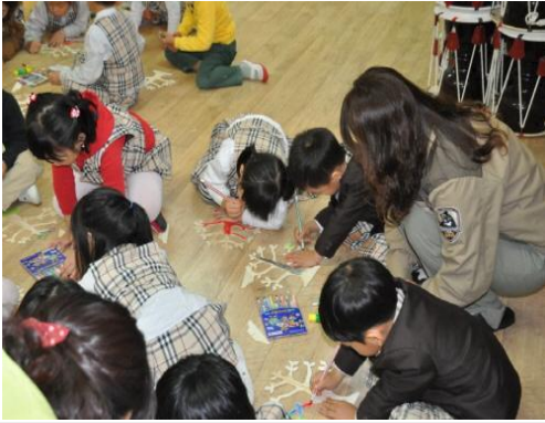
(운영사진_나무전시판 색칠하는 모습)