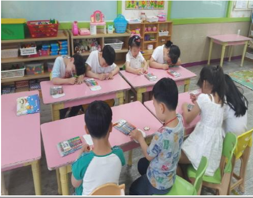
(운영사진_나뭇잎비즈 꾸미는 모습)