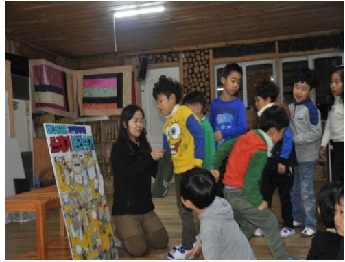
(운영사진_주머니에서 쓰레기 뽑는 모습)