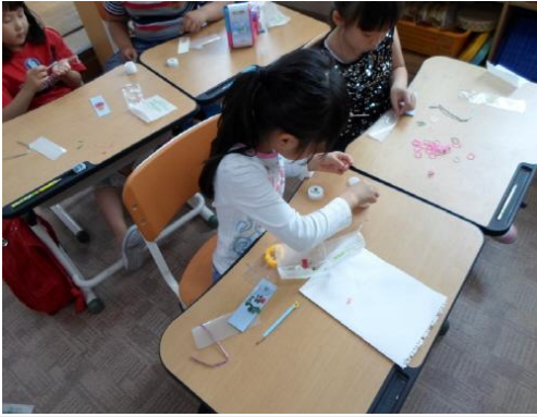
(운영사진_흰종이에 누름꽃 놓는 모습)