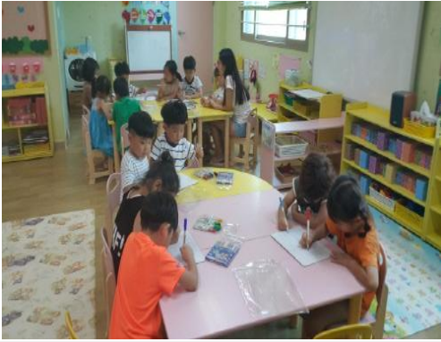
(운영사진_퍼즐판에 그림그리는 모습)