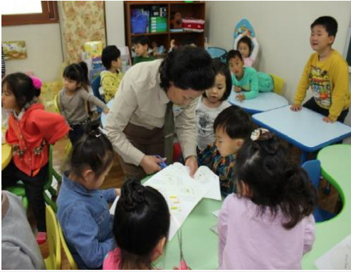
(운영사진_새싹키우기 그림도안 자르는 모습)