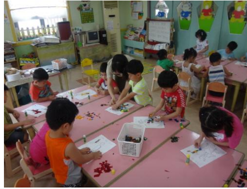
(운영사진_셀로판지로 그림꾸미는 모습)