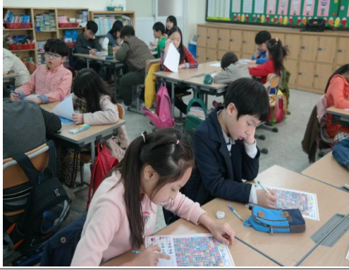
(운영사진_물모습 단어 찾아보는 모습)