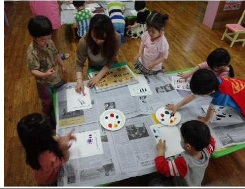
(운영사진_반달가슴곰과 친구들 꾸미기)