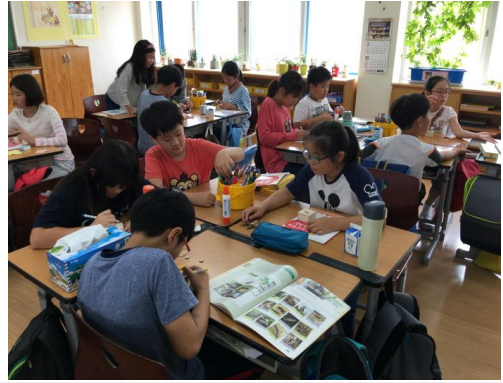
(운영사진_나무연필깎이 꾸미는 모습)