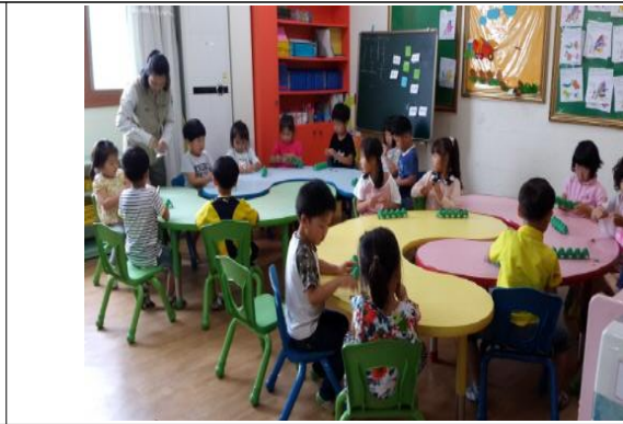
(운영사진_계란판으로 애벌레 만드는 모습)