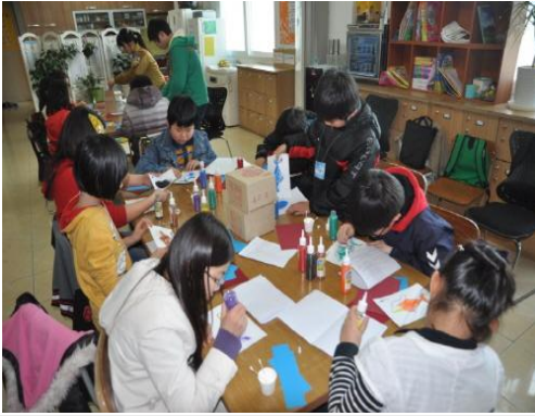
(운영사진_색모래 뿌리는 모습)