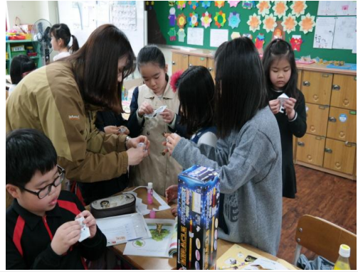
(운영사진_개구리한살이퍼즐 접는 모습)