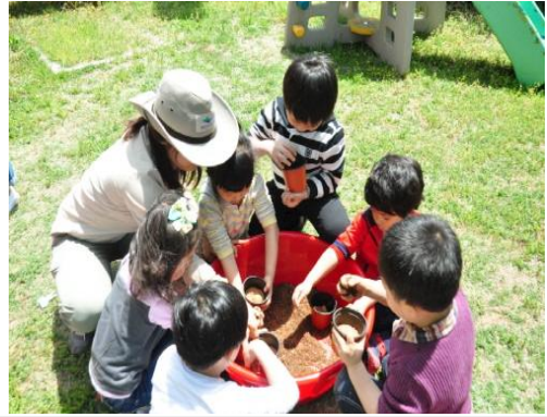
(운영사진_화분에 부엽토 넣는 모습)