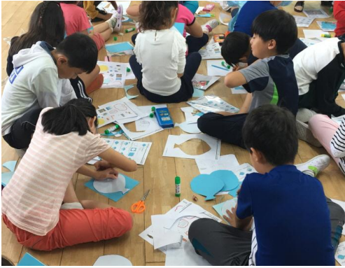
(운영사진_물고기모양으로 오리는 모습)