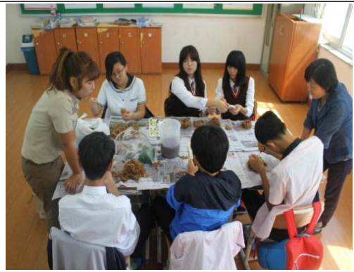
(운영사진_토피어리 만드는 모습)