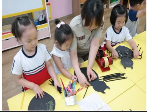
(운영사진_거미그림도안에 빨대 붙이는 모습)