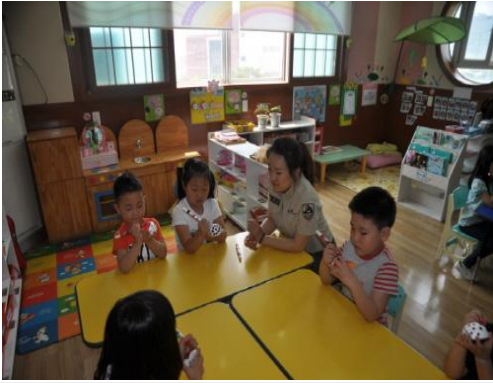
(운영사진_스티로폼반구 색칠하는 모습)