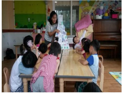
(운영사진_완성한 생태계피라미드 설명)