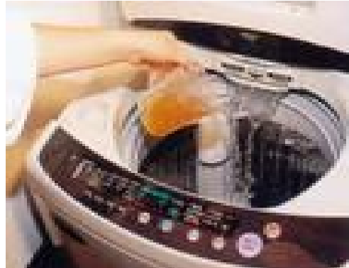
(운영사진_세탁할 때 사용)