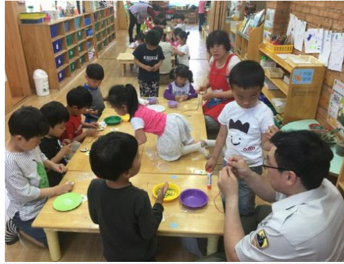
(운영사진_나무작품 목걸이줄 연결하는 모습)