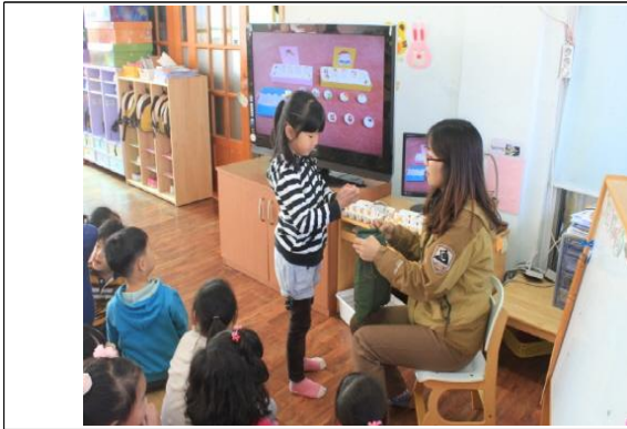
(운영사진_주머니에서 탁구공 뽑는 모습)