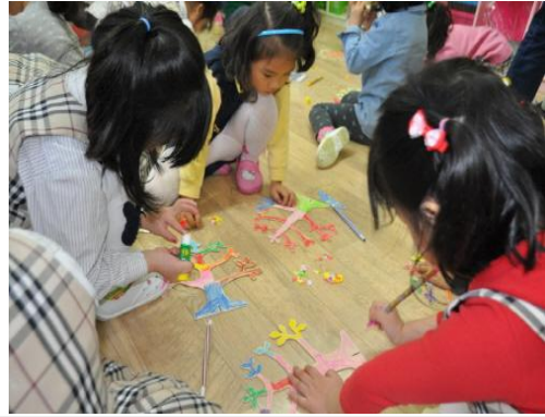
(운영사진_나무전시판에 색종이 붙이는 모습)