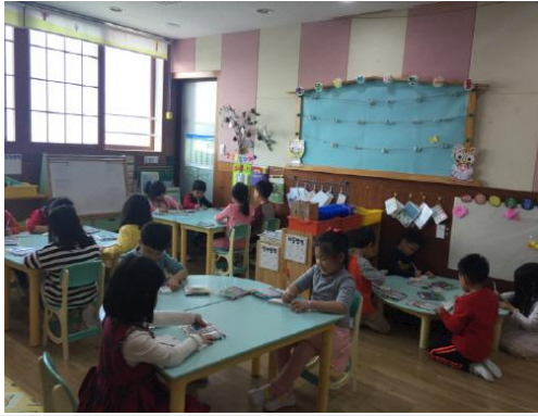
(운영사진_나무판에 그림그리는 모습)