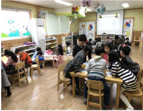
(운영사진_솔방울장난감 만드는 모습)