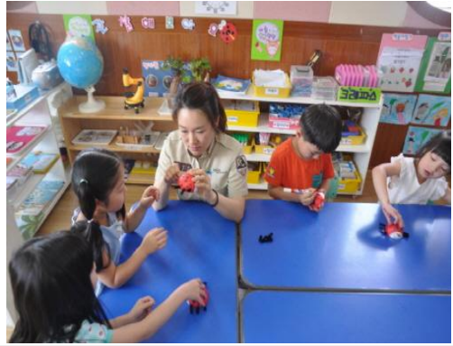
(운영사진_굵은 모루로 다리만드는 모습)