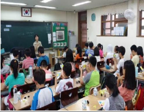
(운영사진_만드는 방법 설명)