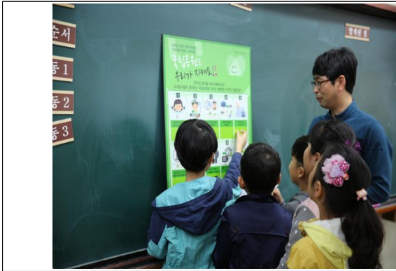
(운영사진_보드판에 스티커 붙이는 모습)