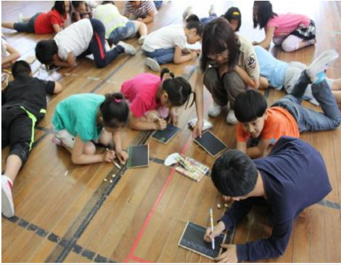
(운영사진_흑도화지에 배경그리는 모습)