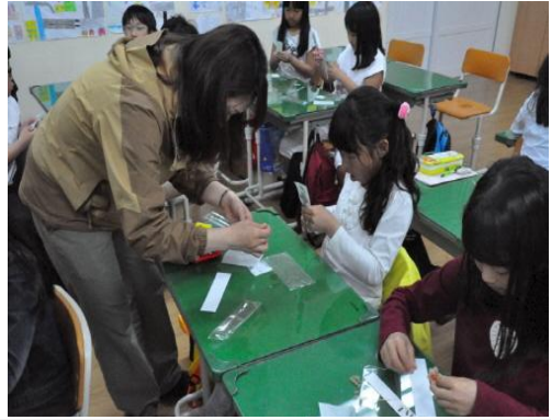
(운영사진_누름꽃자 만드는 모습)