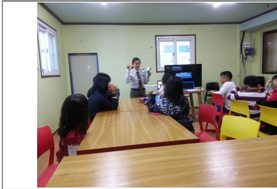
(운영사진_만드는 방법 설명)