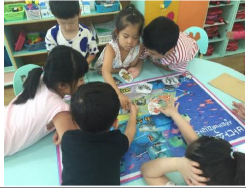
(운영사진_폼보드판에 사진 붙이는 모습)