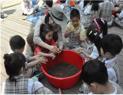
(운영사진_점토에 씨앗볼 싸는 모습)