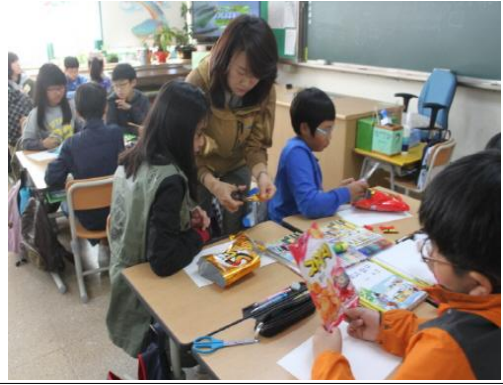
(운영사진_페비닐 잘라 꾸미는 모습)