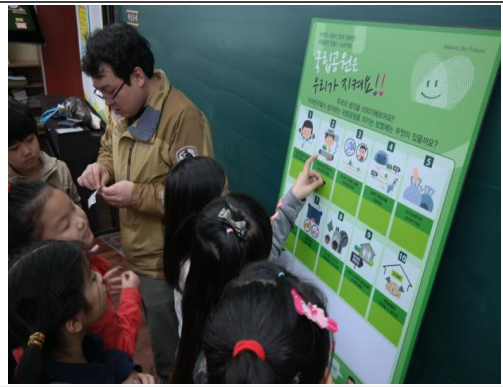
(운영사진_보드판 내용 읽어보는 모습)