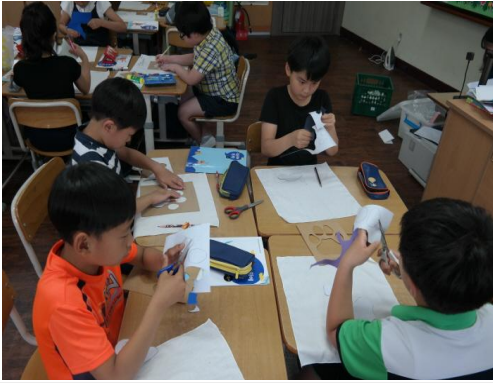
(운영사진_염색종이 오리는 모습)