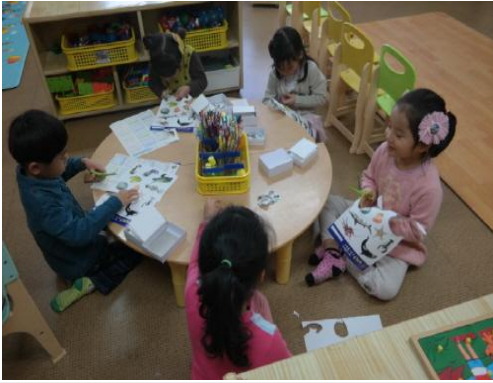
(운영사진_그림도안 자르는 모습)