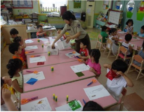
(운영사진_만드는 모습 설명하는 모습)