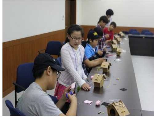
(운영사진_새집 꾸미는 모습)