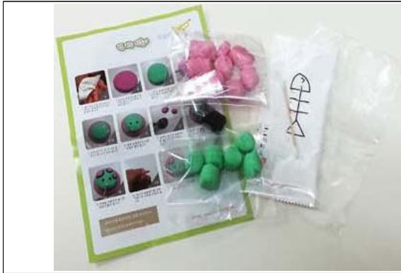
(운영사진_솥클레이 만들기 재료준비)