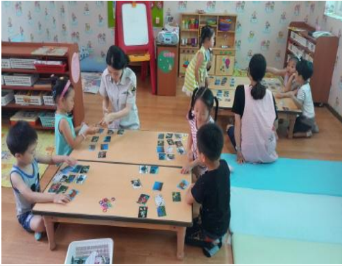
(운영사진_그림카드 살펴보는 모습)