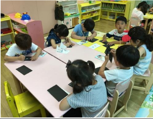
(운영사진_스크래치 그림그리는 모습)