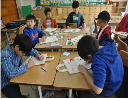
(운영사진_에코백에 그림그리는 모습)