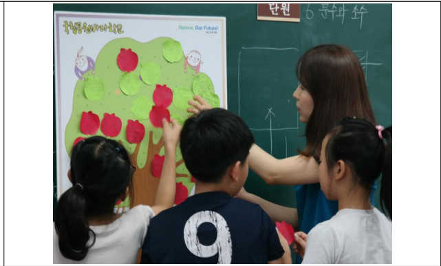
(운영사진_포스트잇에 소망을 적어 붙이기)