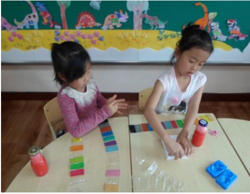
(운영사진_고무찰흙으로 바다생물 만들기)