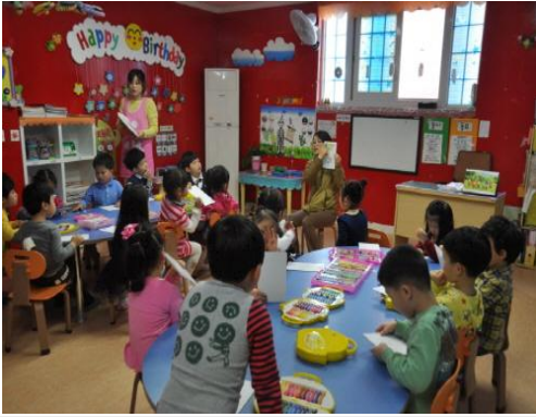
(운영사진_지도퍼즐 만드는 방법 설명)