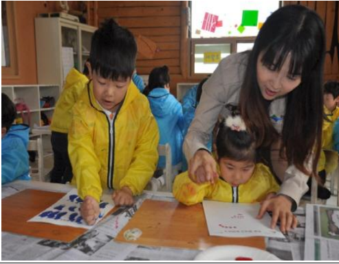
(운영사진_반달가슴곰과 친구들 꾸미기)