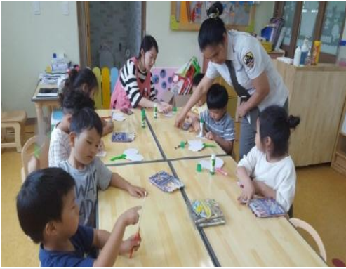
(운영사진_부채종이에 그림그리는 모습)