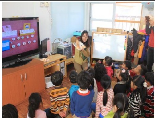
(운영사진_좋은 음식과 나쁜음식 설명)