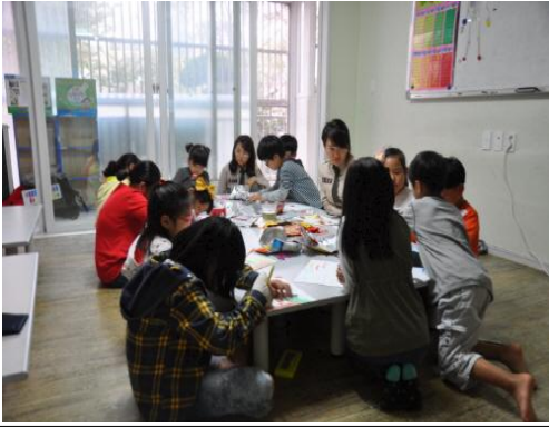
(운영사진_도화지에 밑그림 그리는 모습)