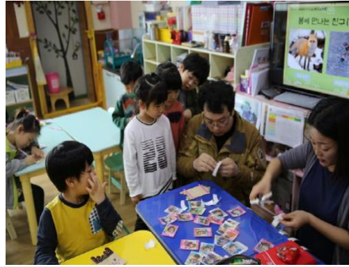
(운영사진_나무액자에 사진붙이는 모습)