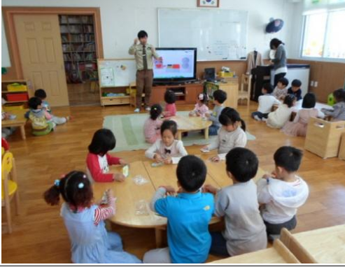
(운영사진_양초만드는 방법 설명하는 모습)