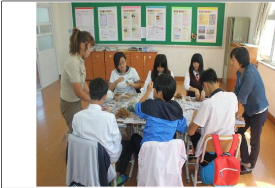
(운영사진_토피어리 만드는 모습)