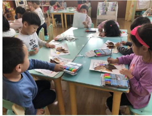
(운영사진_낙엽으로 꾸미고 보완하는 모습)