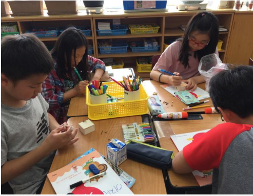
(운영사진_나무연필깎이 꾸미는 모습)