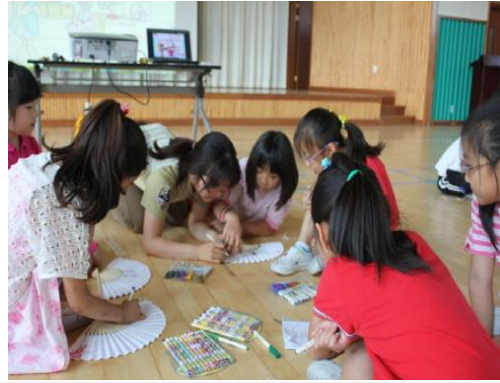
(운영사진_부채에 그림그리는 모습)