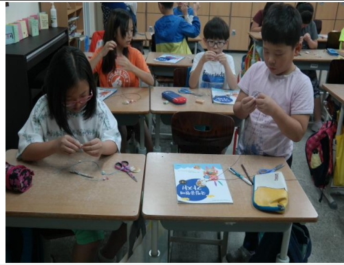
(운영사진_철사에 조개껍질끼우는 모습)