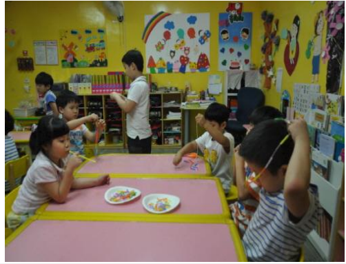
(운영사진_완성한 빨대 걸어보는 모습)