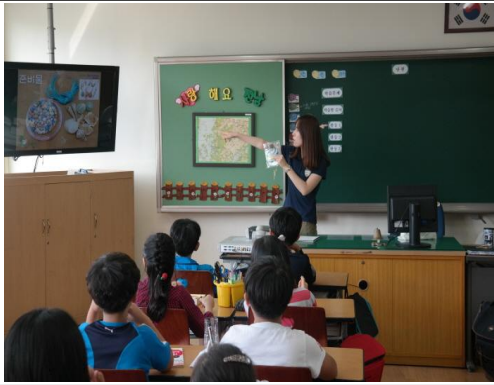
(운영사진_만드는 방법 설명하는 모습)