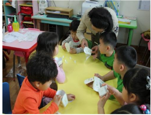
(운영사진_접어서 상자 완성하는 모습)