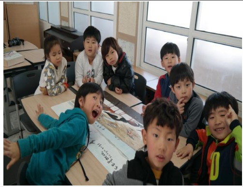
(운영사진_완성된 퍼즐 살펴보는 모습)