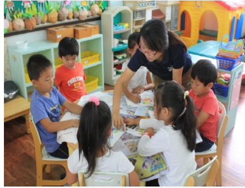
(운영사진_동물 발자국 손수건 꾸미기)