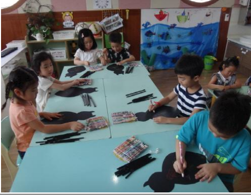
(운영사진_거미그림도안에 그림그리는 모습)