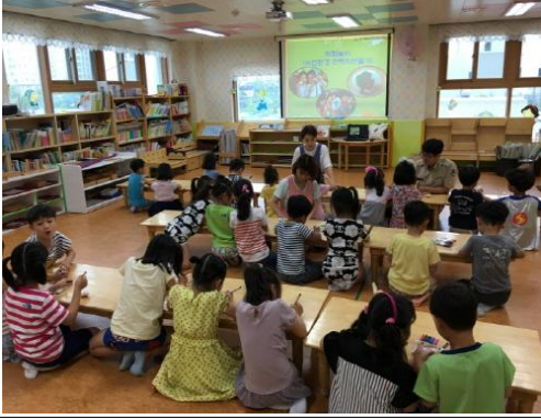
(운영사진_천뱃지에 그림그리는 모습)