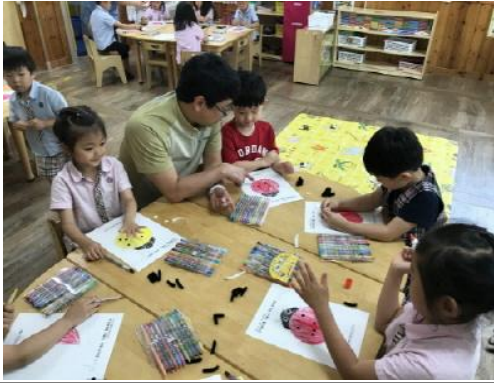
(운영사진_무당벌레 색칠하는 모습)