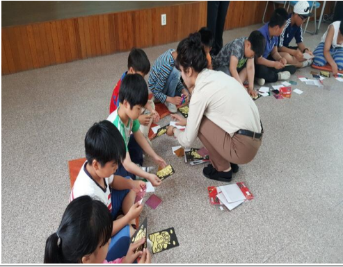
(운영사진_그림도안 살펴보는 모습)