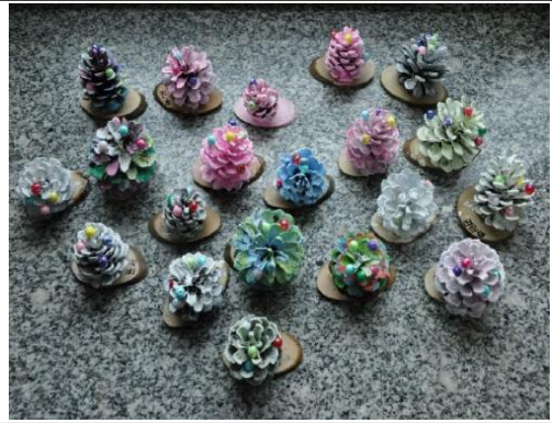
(운영사진_완성한 솔방울 트리 모습)