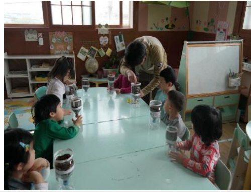
(운영사진_배양토에 씨앗심는 모습)