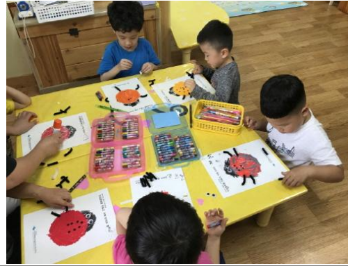
(운영사진_무당벌레 다리 붙이는 모습)