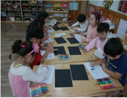
(운영사진_별자리 그림도안 색칠하는 모습)