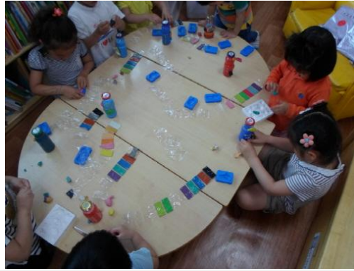
(운영사진_바다생물 수족관에 꾸미는 모습)