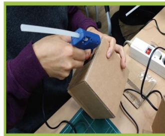
글루건을 이용하여 각 면들을 접착한다.