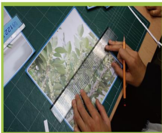
큐브에 들어갈 내용물을 제작한다.