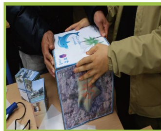
큐브의 시트지가 붙여진 방향과 전체 상태를 확인하여 마무리 한다.

돌피니큐브 는 다도해해상국립공원 미래세대 프로그램인 바다학교의 체험과정에 이용하고 있으며, 참가자들이 국립공원의 동식물 및 자연경관, 명품마을을 한 눈에 알아볼 수 있도록 제작하였습니다.