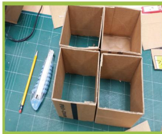
페박스과 페우유팩을 정육면체로 제단한다.