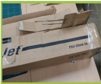
큐브를 만들기 위한 페박스와 페우유팩을 준비한다.