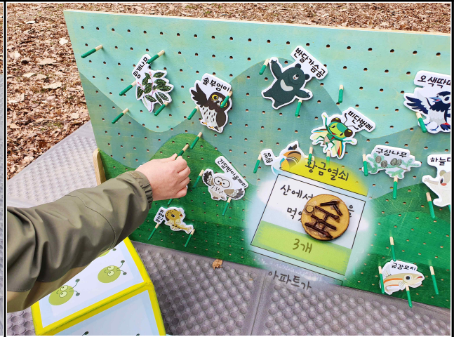
▷ 교구재 활용