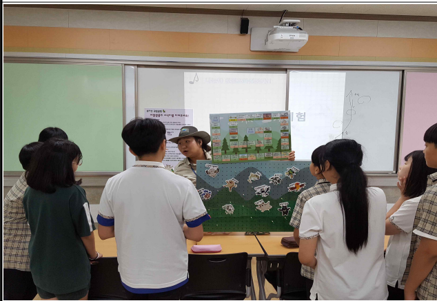
▷ 활동 모습(중학교 1학년)