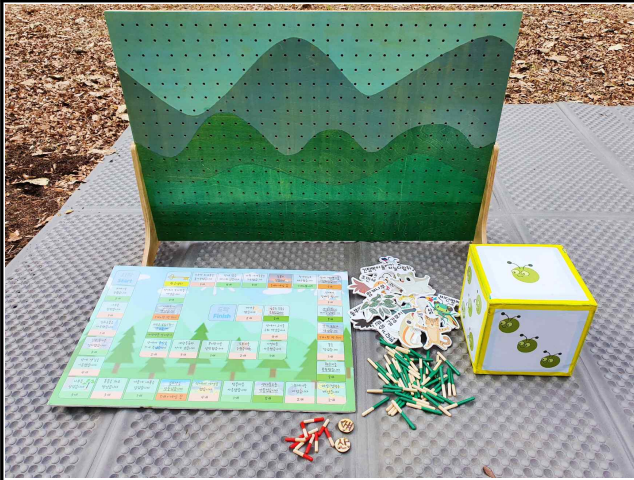
▷ 숲 살리기 교구재 1벌