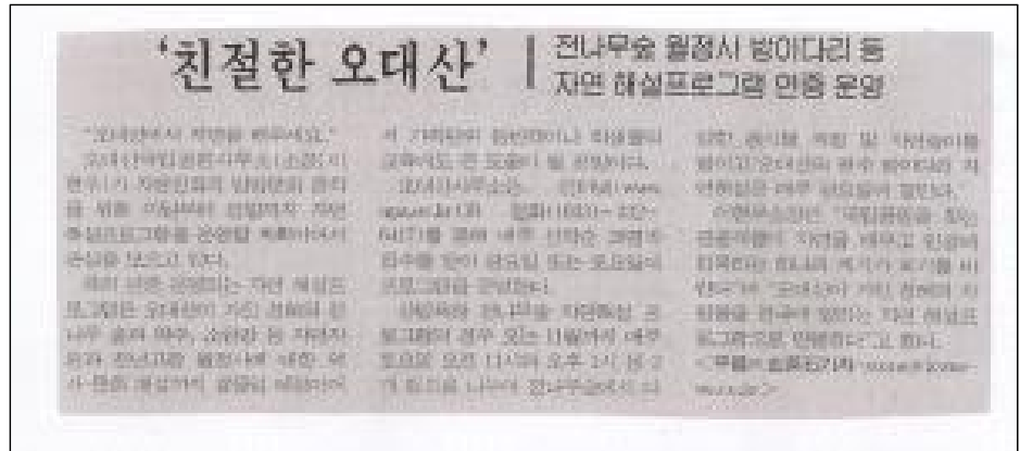
친절을 베푸는 방법은 다양하다.