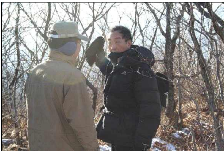
언제 어디서나 고객의 말에 귀 기울이고, 고객의 입장에서 이해하자!!!