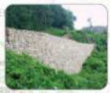
보은 장년산성(산의 계235호)과 함께 대표적인 삼국시대 산성으로 알려져 있습니다.