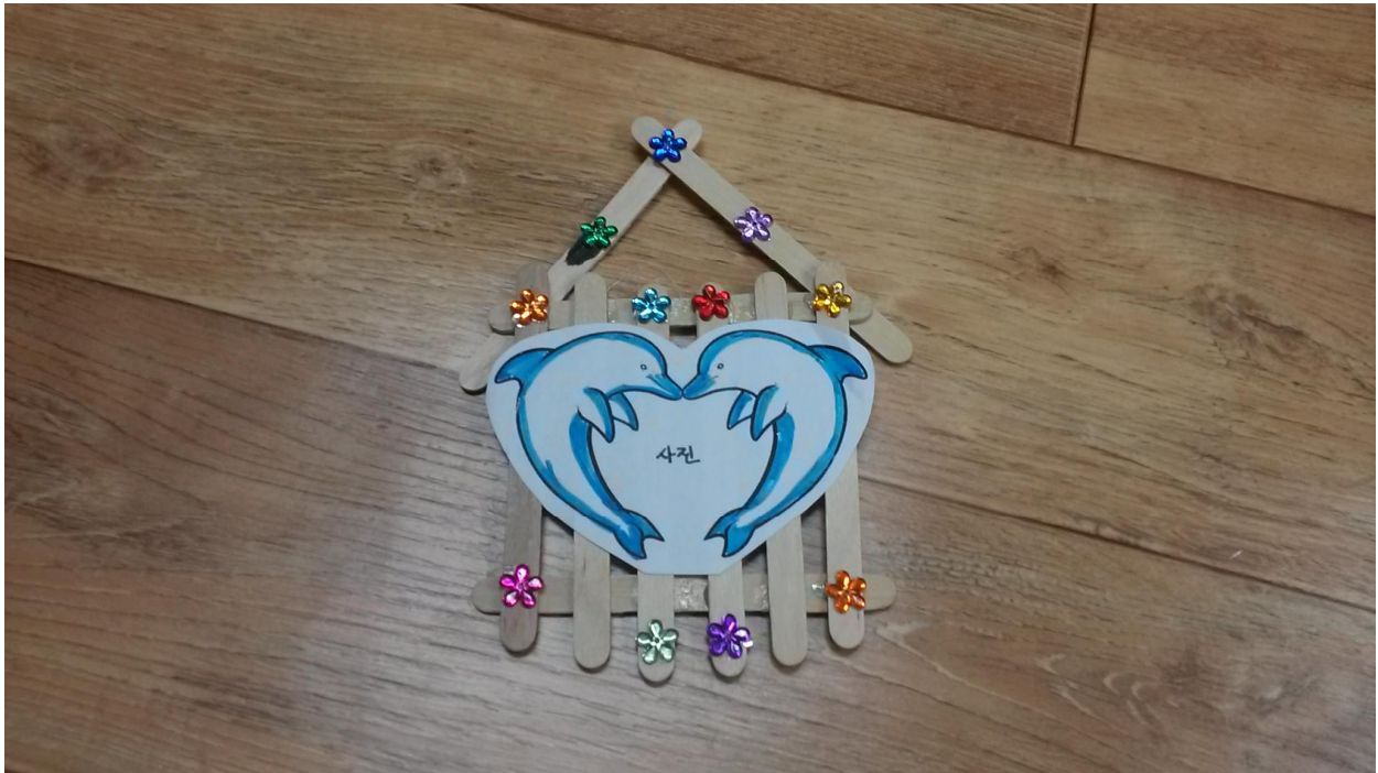
<완성된 교구재 사진 삽입>